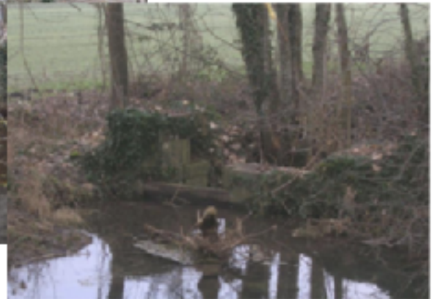
L'ouvrage de répartition