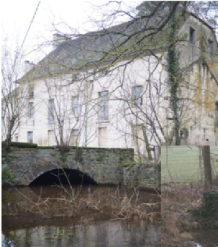
Le Moulin Bruet