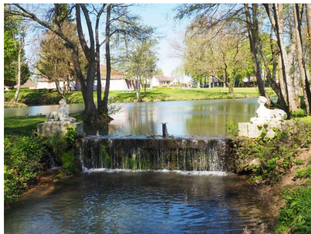
L'Oucherotte et le seuil aux Sirènes

550 mètres et conserver un plan d'eau pour la pratique halieutique.