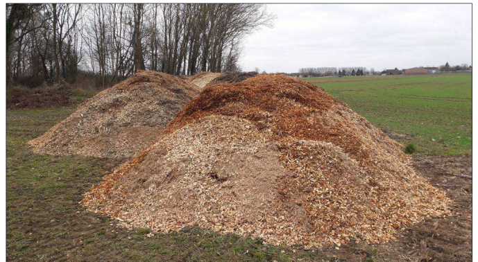
Des copeaux avant livraison